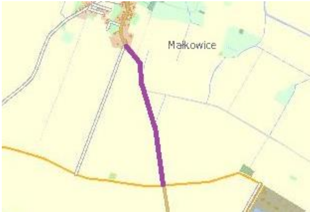
Droga Powiatowa nr 2018D Malkowice – Sadków/Sadowice